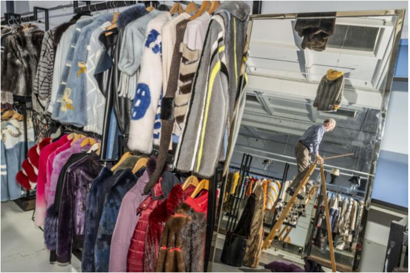
En mand hænger pelsfrakker op i udstillingen under auktionsugen i juni hos Kopenhagen Fur. Frakkerne er designet gennem årene i samarbejde med de største modehuse.

Det er snart tre år siden, at den tidligere S-regering under coronavirussens hærgen udstedte en ordre om, at alle mink i Danmark skulle aflives i november 2020.