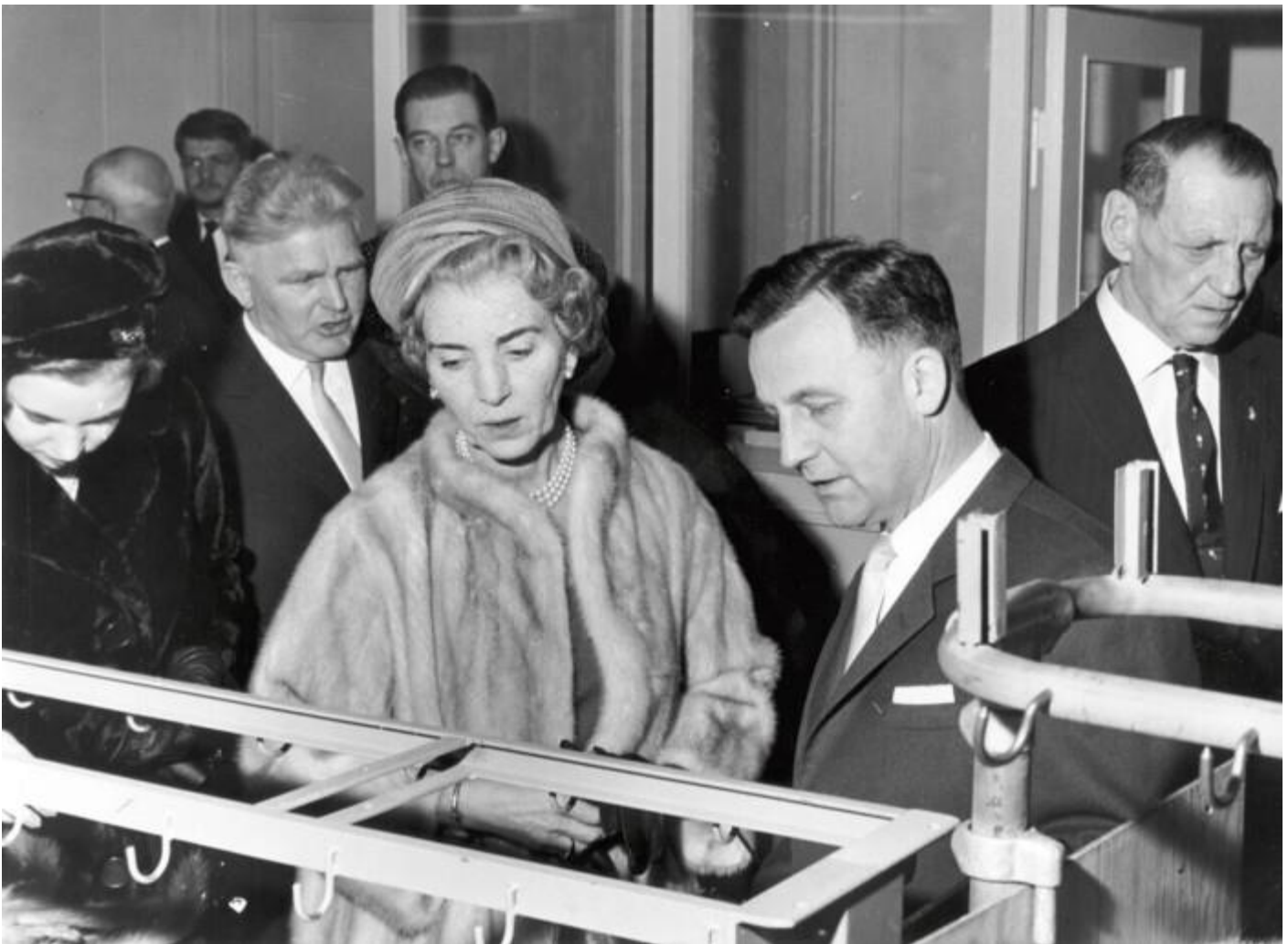
Dronning Ingrid og kong Frederik 9. ved indvielsen af Kopenhagen Furs hovedsæde i 1963.

Bygningen er blevet udvidet markant over tid, men har beholdt samme indvendige stil, som da den i 1963 blev indviet af kong Frederik 9., dronning Ingrid og prinsesse Benedikte.