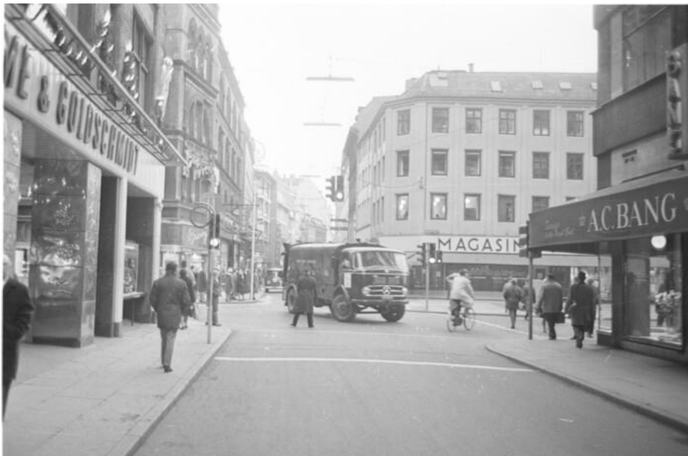
Østergade på Strøget for årtier siden, hvor man kan ane A.C. Bangs facade i højre side og Magasin i baggrunden. Billedet er udateret.

Den gamle Birger Christensen-butik slog dog dørene op på Østergade for sidste gang i 2021 . Efter 152 år forsvandt et stykke københavnerhistorie fra bybilledet.